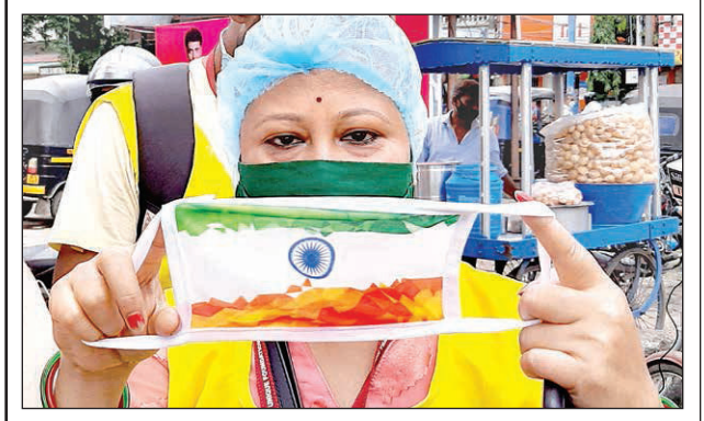
তেরঙ্গা মাস্ক বিক্রি বন্ধে পথে স্বেচ্ছাসেবীরা।