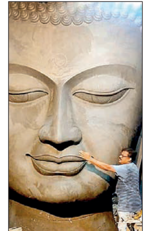
কুমোরটুলিতে বুদ্ধের মুখ! কাজ শেষ হলে নিয়ে যাওয়া হবে গয়ায়⊠সেখানেই তৈরি হচ্ছে মূর্তির বাকিটুকু। মঙ্গলবার।